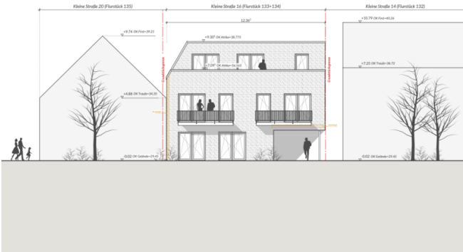
Süd-Ansicht | M 1: 100